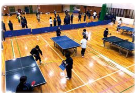
ポロニアスポーツフェスティバル (桐ヶ丘体育館)