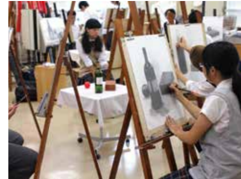
アート・デザイン系列「素描A」