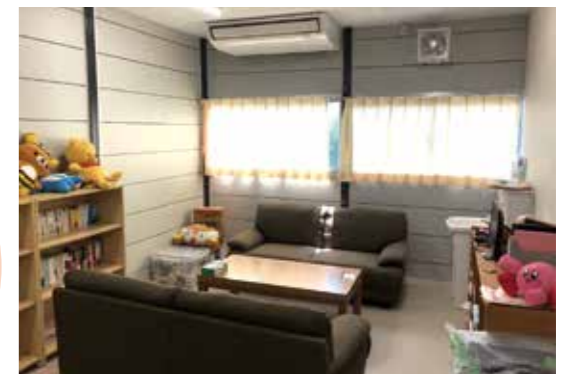
だれでも利用できるカウンセリングルーム