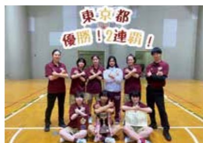
バスケットボール部 (女子)