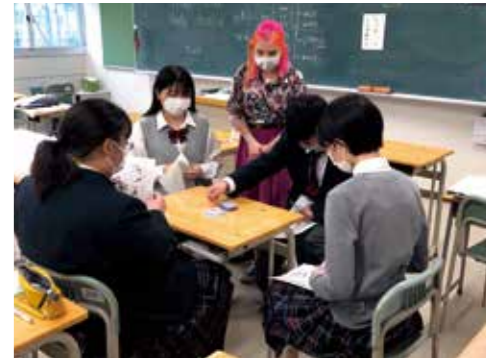
JET (外国人講師)による「英コミュ」