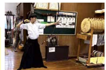
弓道部 (桐ヶ丘体育館)