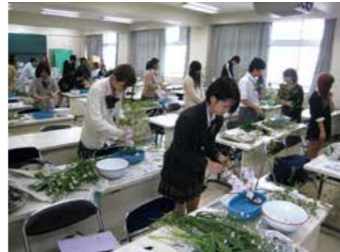
華道の先生を招いての「人と地球」