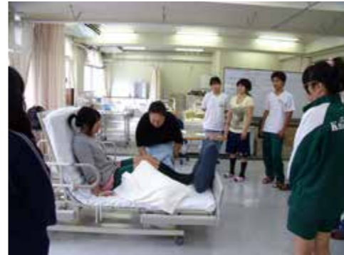
福祉系列「介護実践」