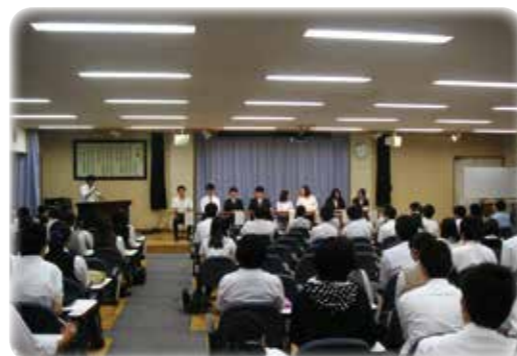
卒業生進路座談会