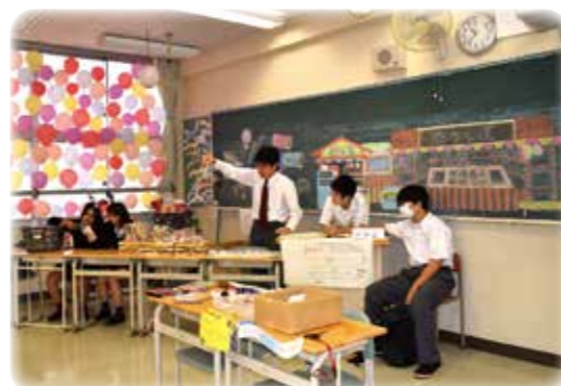
ポロニアフェスティバル