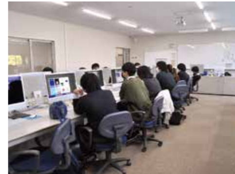
最新のMacを活用した「CG」