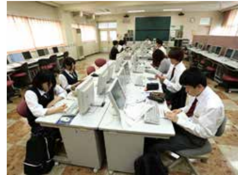
情報・ビジネス系列「情報処理」